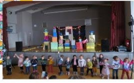
Décembre Spectacle Jeune Public ouvert à tous

Ces moments ont été rendus possibles grâce à la formidable mobilisation des bénévoles, permanents ou occasionnels qui mettent temps, disponibilité et créativité au service de tous.