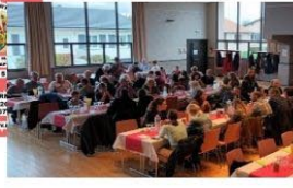
Octobre Journée jeux, repas et concert