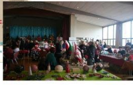
Novembre Marché de Noël