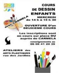
Nouveau créneau DESSIN ENFANT