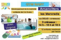
Nouveaux créneaux BABYGYM