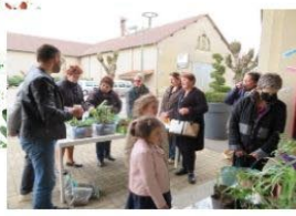
Avril Bourse aux plantes