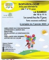
Sophroludique ENFANT Testé en novembre, cet atelier sera mis en place dès janvier 2023