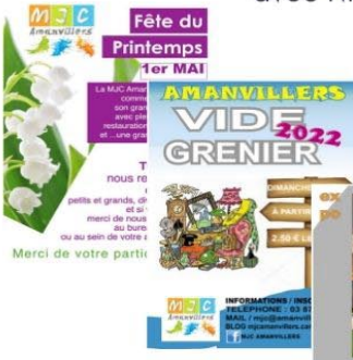
Mai Fête de la MJC Vide Grenier et exposition des ateliers d'art