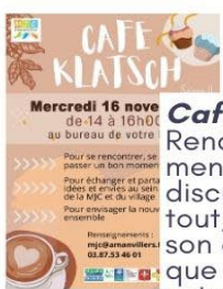
Café Klatsch Rendez-vous mensuel pour discuter de tout, donner son avis sur ce que propose votre MJC ou apporter ses idées et envies.