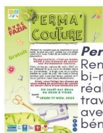
Perma'couture Rendez-vous bi-mensuel pour réaliser vos travaux couture avec l'aide d'une bénévole à votre service et la machine mise à votre disposition.